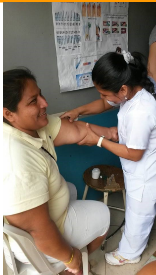
Waar zit die ader?