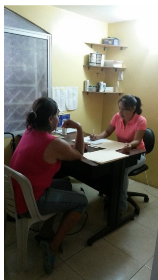
De verloskundige tijdens de open dagen.

klacht was en waarom ze precies een bepaalde behandeling gaf. Alhoewel het hier in sommige gevallen net wat anders gaat dan in Nederland, zijn dit soort dingen zijn erg leerzaam.