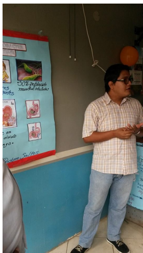
Voorlichting is een belangrijk onderdeel.