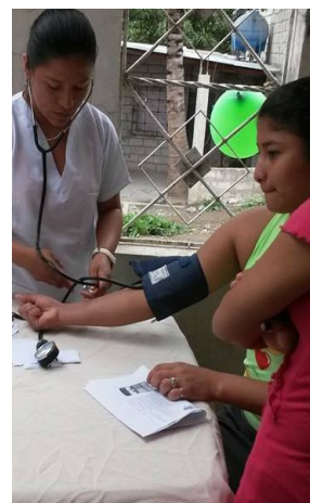
Ook werd de bloeddruk gemeten.

La Sonrisa Naranja is op zoek naar €30.000-