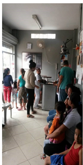
Gezellig druk in de wachtkamer