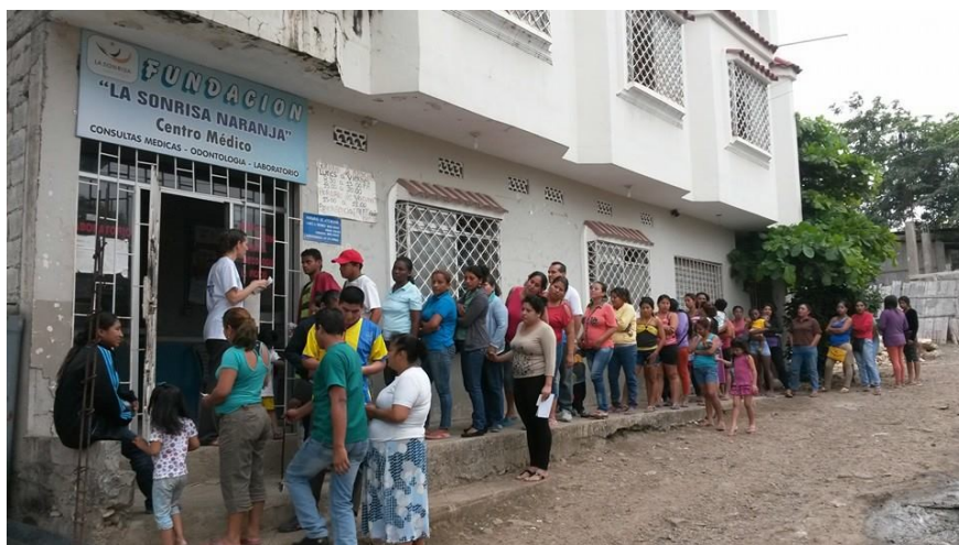
Alweer drukbezochte open dagen