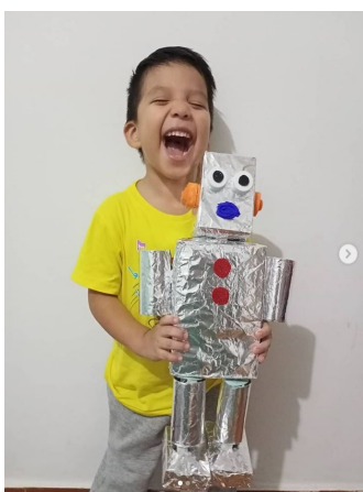
Zoveel plezier kun je hebben met kartonnen dozen